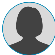
Mylène RIAD Champs-sur-Marne