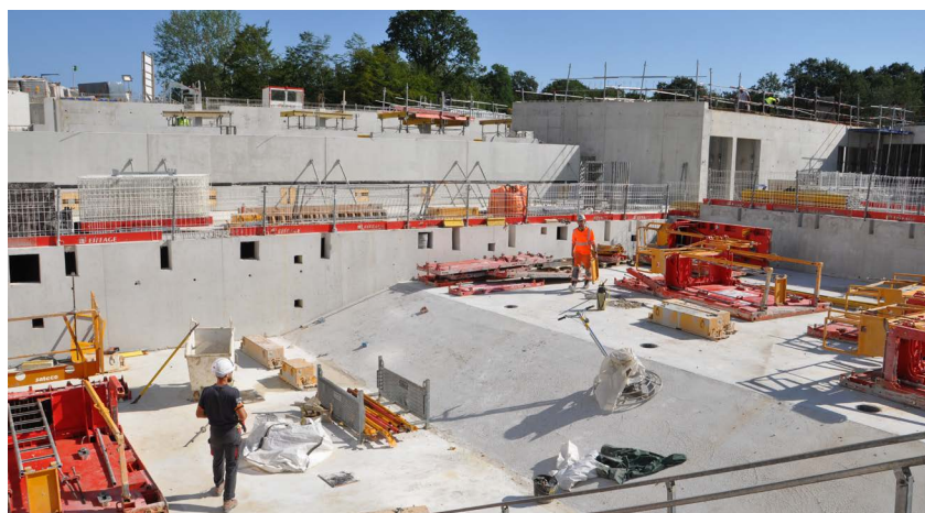
La dalle supportant le futur bassin nordique de 50 mètres a été coulée fin août 2021