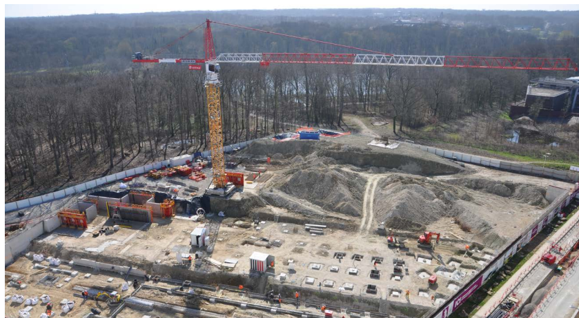
Après le terrassement, une grue a surplombé le site entre mars et novembre 2021

Désormais, l'Agglomération aura la charge d'entretenir ce magnifique équipement, comme elle entretient l'ensemble des équipements aquatiques sur son territoire.