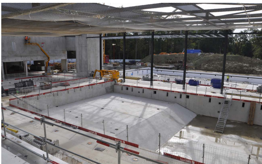
Le bâtiment a été mis hors d'eau et hors d'air depuis la fin 2021, après l'installation de toutes les surfaces vitrées