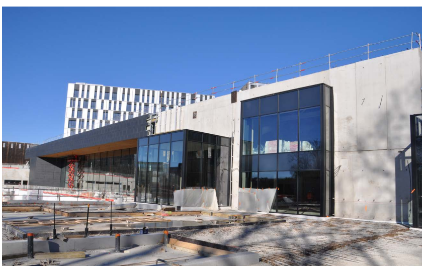
Le chantier s'est achevé avec la pose de la façade, diverses interventions intérieures et les plantations en extérieur.