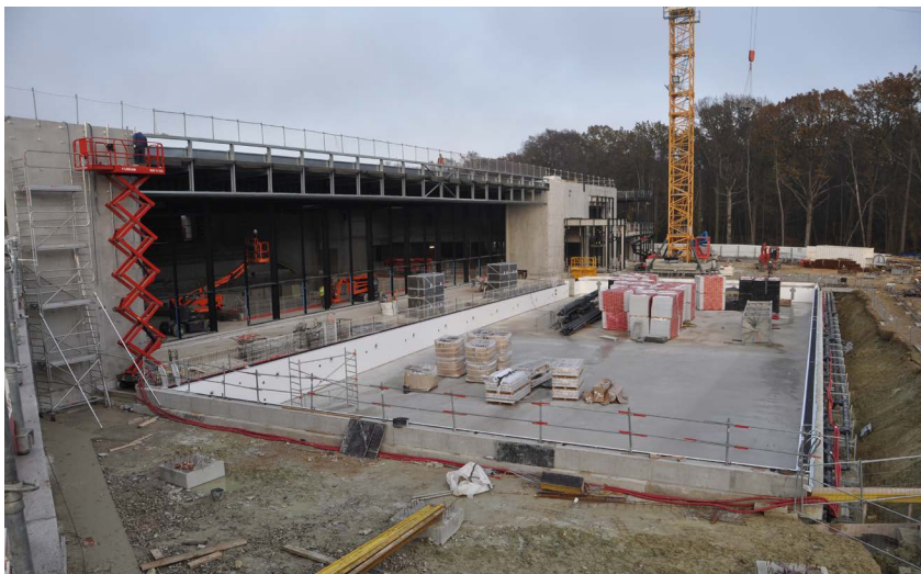
Les murs et cloisons de grande hauteur ainsi que les planchers des rez-de-jardin et rez-de-chaussée ont été achevés en septembre 2021.