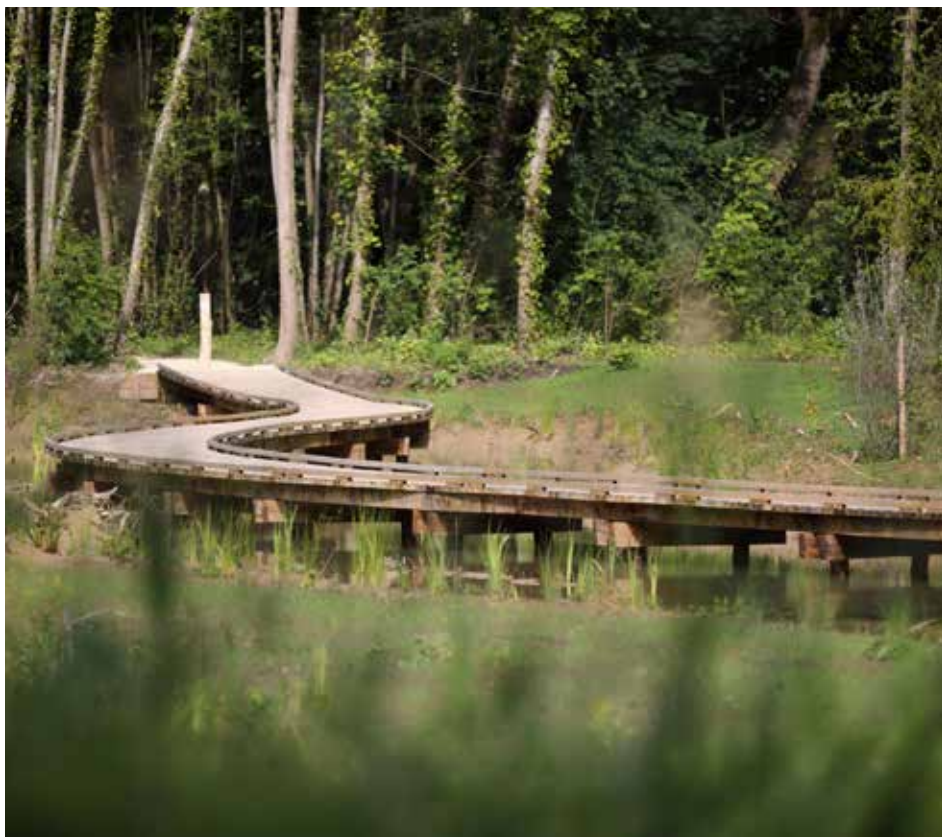
L'Île de Douvres

Coût des travaux : 685 000 € (dont 170 000 € de subvention de la Région Île-de-France, 125 000 € de l'Agence de l'eau Seine-Normandie et 100 000 € du Département de Seine-et-Marne).